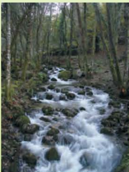
Regato do Batán