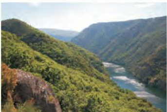
Canón do Sil dende o miradoiro da Galiña