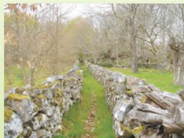
"Carriozas" en Fondodevila